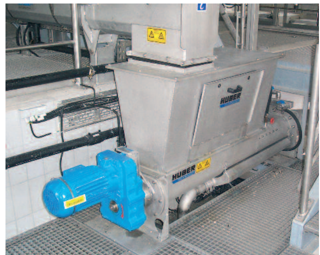
Tratamiento eficaz del residuo de desbaste con WAP.