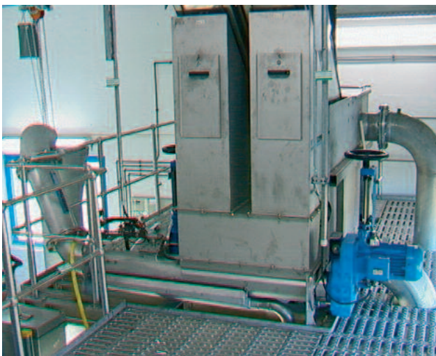
HUBER ROTAMAT WAP para cualquier tipo de descarga.