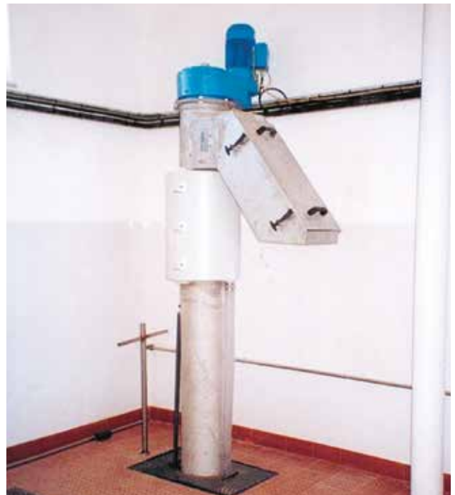
„Platzsparende Aufstellung im Gebäude.“