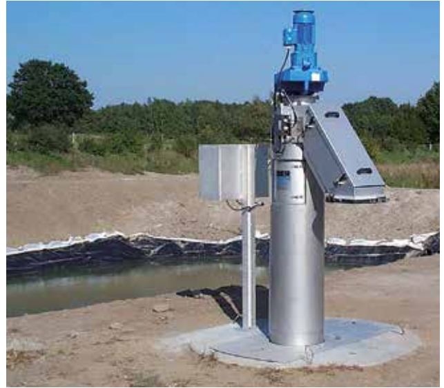
„Einsatz im Zulauf vor einer Teichkläranlage.“