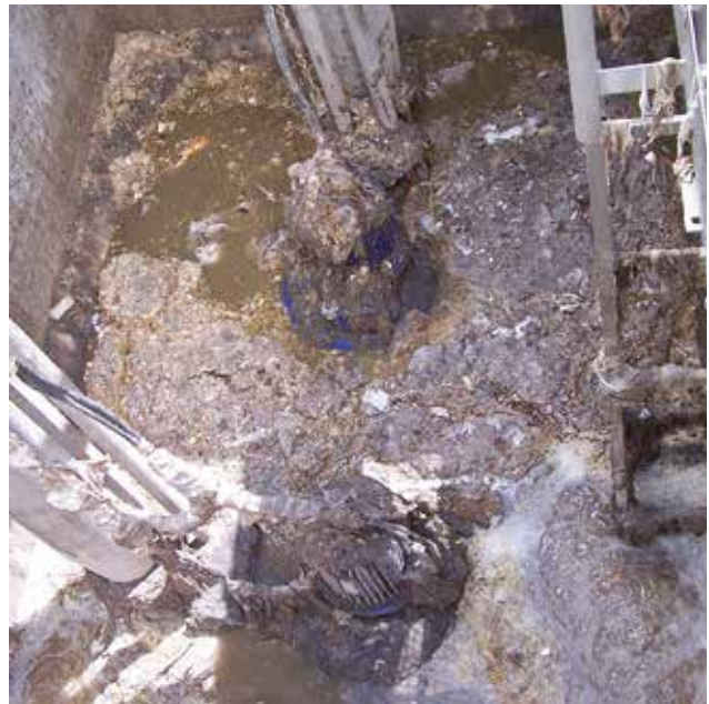
„Verstopfte Förderpumpen durch Feststoffe im zu fördernden Medium.“

Zur Wahrung der Notlaufeigenschaften ist die seitliche Zuführkammer nach oben hin offen gestaltet, so dass die Maschine, beispielsweise bei Stromausfall, problemlos überströmt werden kann. Der integrierte Sohlsprung verhindert einen Rückstau durch die Siebanlage in das oberhalb liegende Kanalnetz und vermeidet somit unerwünschte Ablagerungen im Zulaufkanal.