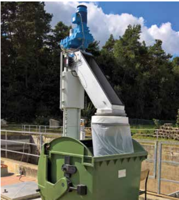
„Vorteilhafte Siebgutentsorgung über eine Endlosabsackvorrichtung.“