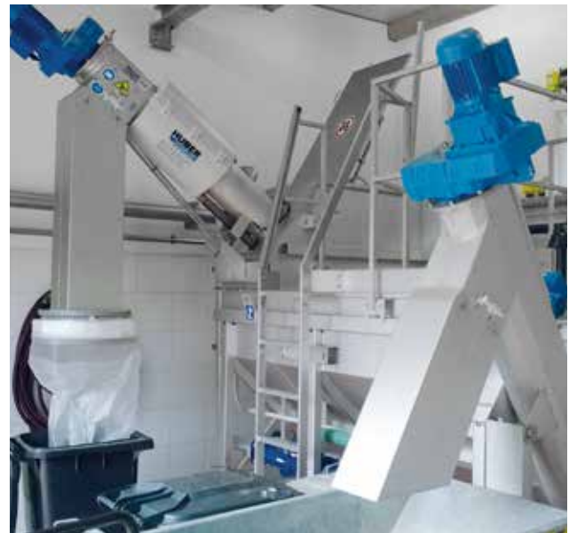
HUBER Kompaktanlage Hydro Duct ROTAMAT® Ro5 HD mit integriertem Sandwäscher.